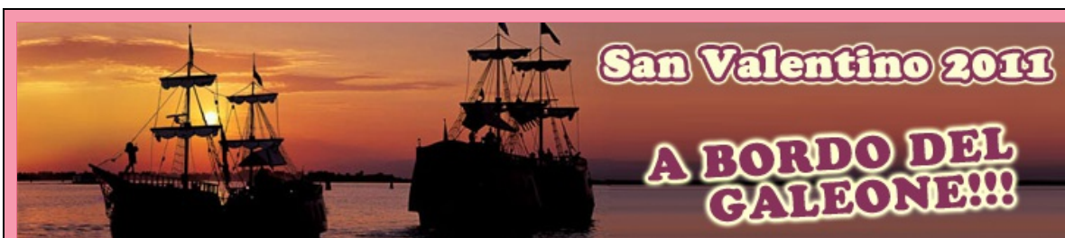
San Valentino a bordo del Galeone